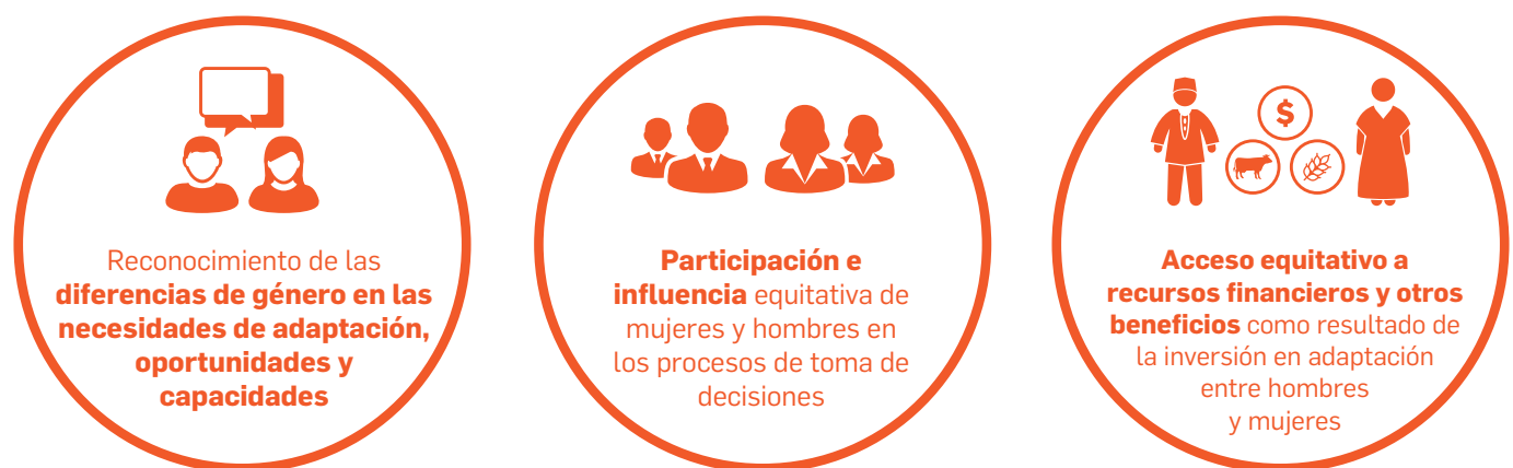
Figura 1. Dimensiones de un proceso PNAD con perspectiva de género

El análisis técnico se centra en comprender las cuestiones de género que se deben tener en cuenta en la planificación, la asignación de prioridades y la implementación de las medidas de adaptación. Este análisis estudia las tres dimensiones clave de un proceso PNAD con perspectiva de género (véase la figura 1).